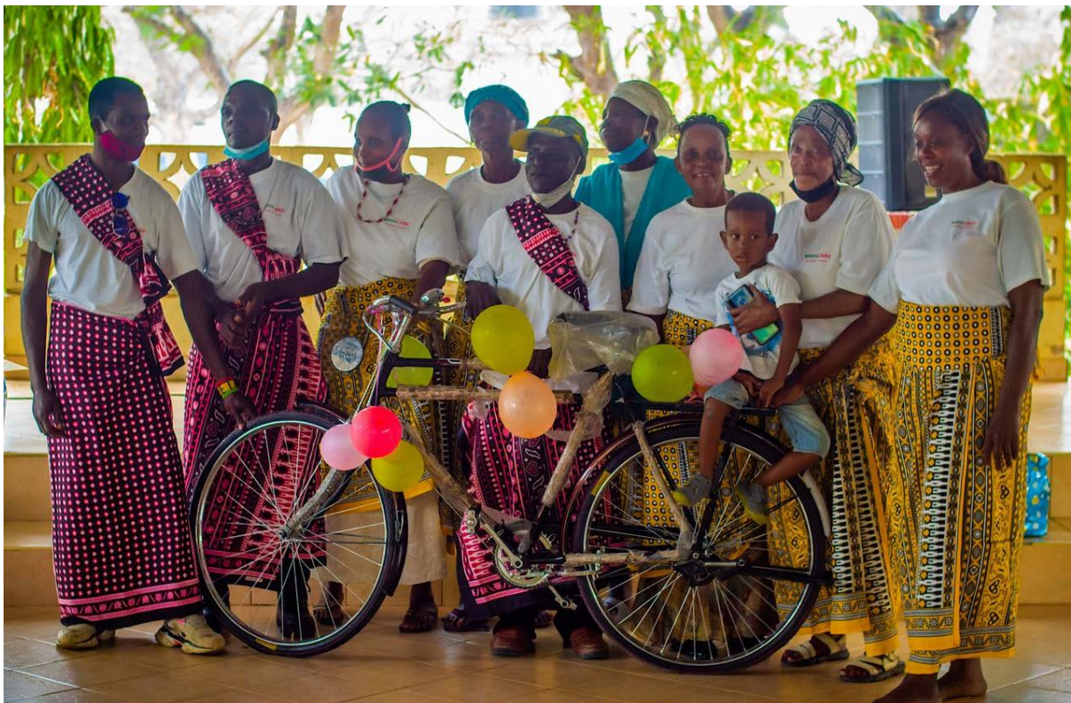
Foto: Kenya Care - Feestelijke afronding programma van de Neema Self Help Group